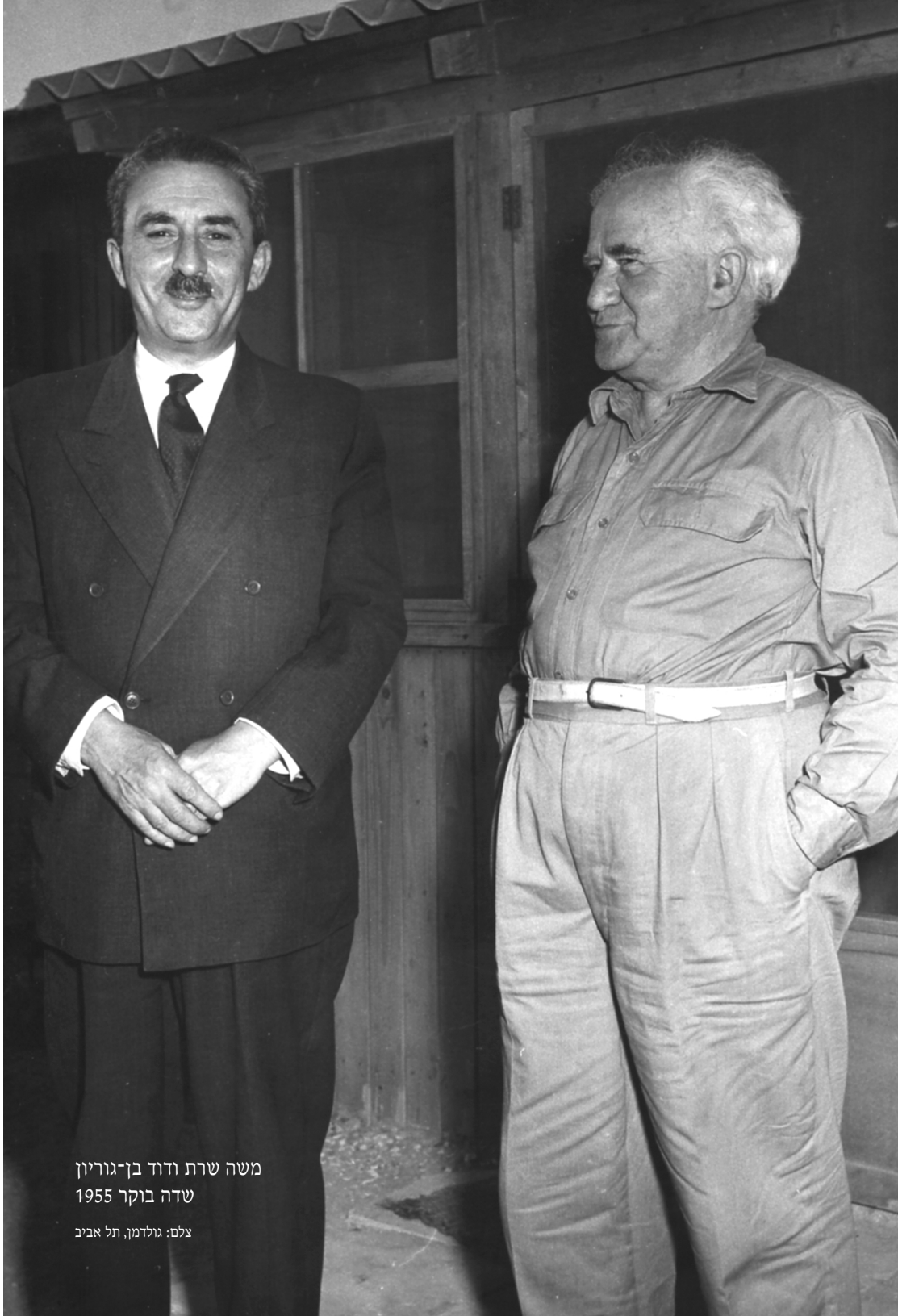
משה שרת ודוד בן-גוריון שדה בוקר 1955