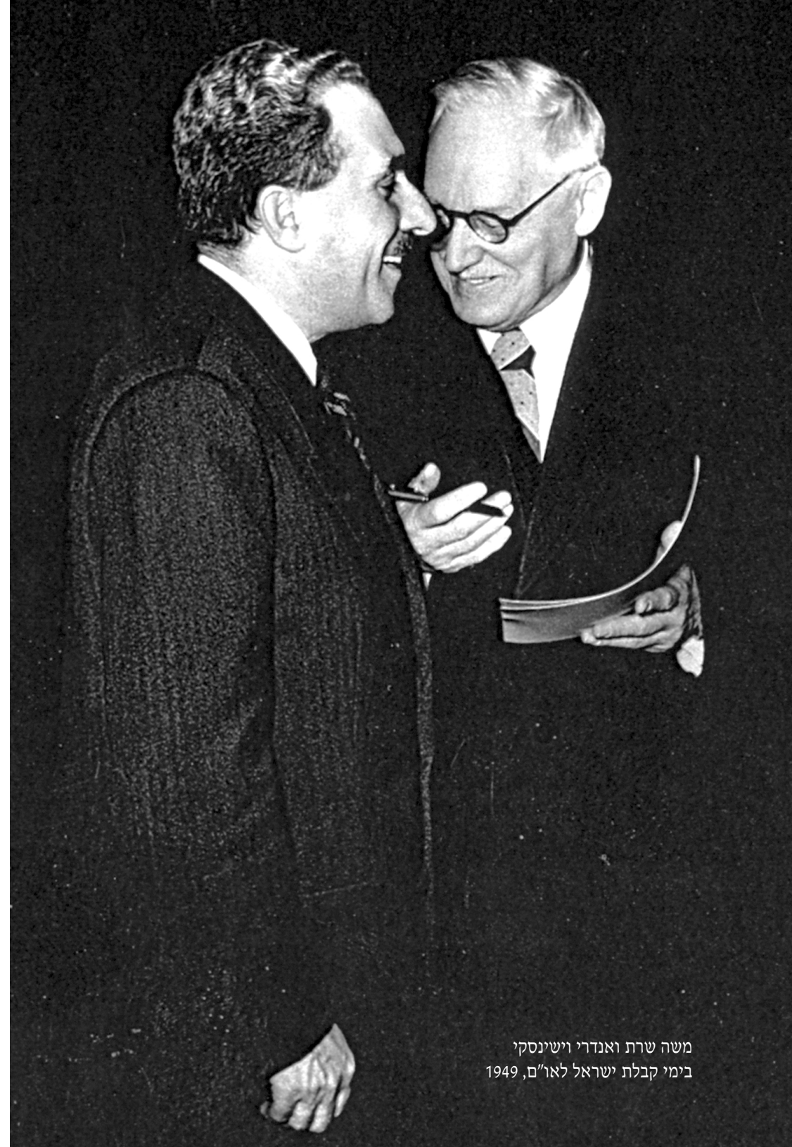
משה שרת ואנדרי וישינסקי בימי קבלת ישראל לאו"ם, 1949