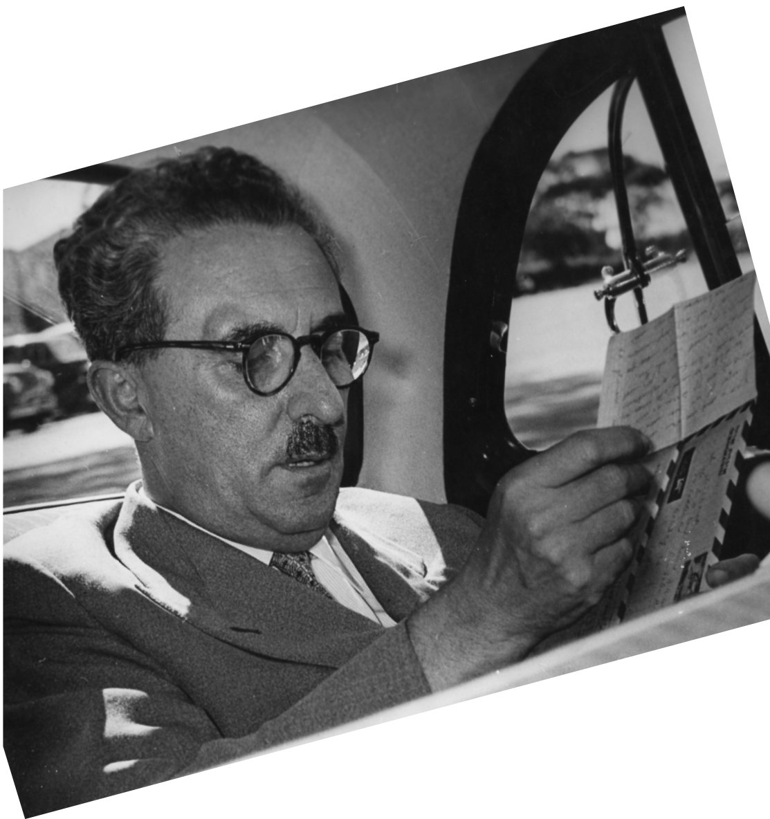
משה שרת במסעו להודו, אוקטובר 1956