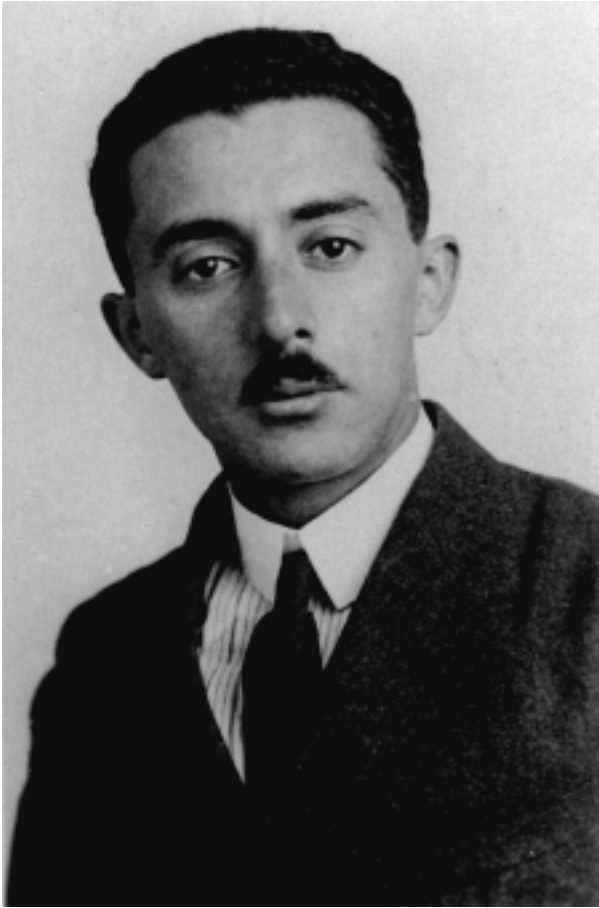
משה שרת בשנות ה-20