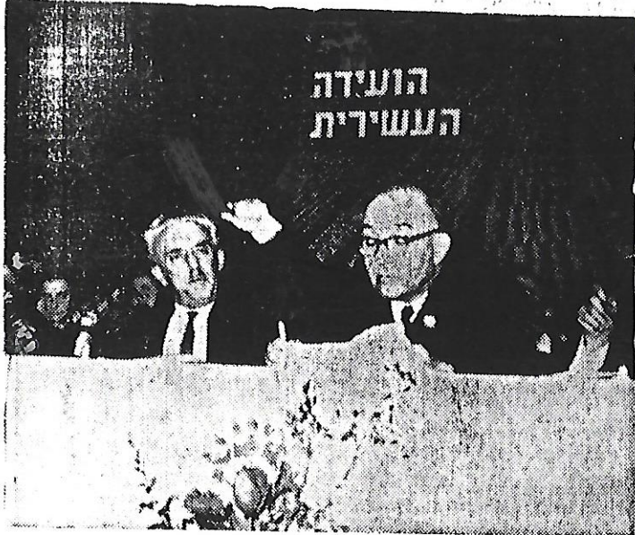
משה שרת נואם בוועידת מפא"י

עד מהרה נתאמת ספק זה: תוך קריאות-ביניים שנמשכו כמעט כל שעת הרצאתו חזר והסביר שרת מדוע אין להמשיך כטיפול ב"פרשה". הוא אמר, כי אי אפשר להי קור מעשי ועדת-השבעה, אם אין רוצים למוטט יסודות הדמוקרטיה. בן-גוריון לא הצליח לדבריה לשכנע את המוני העם בתשיבותיו המכריעות של הענין. שרת קשר וברוי תהילה לדמותו של בן-גוריון, אך אמר, כי מעמדו כעם מסיל עליו אחריות כבירה. מנהיג אינו יכול לרכוז כל מעייניו כמה שקרה לפני 11 שנה. או שהוא מושך ידו מן הענין ומחזיר את עצמו למסלול המרכזי של סדר-היום הממלכתי או שהוא מותיר על כתר המנהיגות, כי בכך הוא מתחיל כבודה של המנהיגות. שרת אמר, כי בן-גוריון ב"התעקשותו" מערער את יוקרת המדינה בעיני העם ובציני אומות העולם. שרת רמז לדיון ודבריו המור שיש לו עצמו עם בן-גוריון היביר על דברים. שרת רותם עדיין כאש מתלקחת בלבו ולצורך הכירור הוא אני כונש אותה".