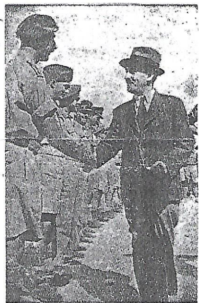
שרתוק משוחח עם קציני החי"ל