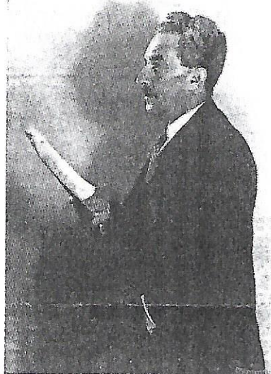
צילום הכותב יחד עם משה שרת